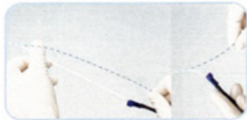
ΜΟΝΑΔΙΚΗ ΤΕΧΝΟΛΟΓΙΑ ΑΠΕΛΕΥΘΕΡΩΣΗΣ ΤΟΥ ΣΥΡΜΑΤΟΣ ΜΕΧΡΙ ΤΟ ΤΕΛΙΚΟ ΑΚΡΟ ΓΙΑ ΠΡΑΓΜΑΤΙΚΗ ΤΑΧΕΙΑ ΑΝΤΑΛΛΑΓΗ