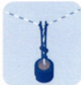
ΣΥΣΤΗΜΑ ΣΥΓΚΡΑΤΗΣΗΣ ΣΥΡΜΑΤΟΣ