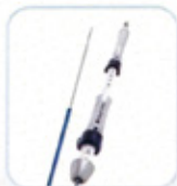
EUS-FNA ΜΟΝΑΔΙΚΟΣ ΜΗΧΑΝΙΣΜΟΣ TWIST LOCK ΓΙΑ ΑΝΟΙΓΜΑ ΒΕΛΟΝΑΣ ΚΑΙ ΘΗΚΑΡΙΟΥ ΜΕ ΤΟ ΕΝΑ ΧΕΡΙ