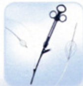
ΚΑΛΑΘΙΑ ΣΥΛΛΗΨΗΣ ΛΙΘΩΝ 8 ΣΥΡΜΑΤΩΝ ΜΕ ΔΥΝΑΤΟΤΗΤΑ ΠΡΩΘΗΣΗΣ ΤΟΥ ΣΥΡΜΑΤΟΣ ΜΕΣΩ ΤΟΥ ΤΕΛΙΚΟΥ ΑΚΡΟΥ ΤΟΥ ΚΑΘΗΤΗΡΑ