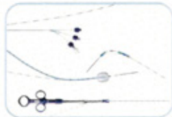
ΣΥΣΤΗΜΑΤΑ ΤΑΧΕΙΑΣ ΑΝΤΑΛΛΑΓΗΣ (SHORT TRACK)